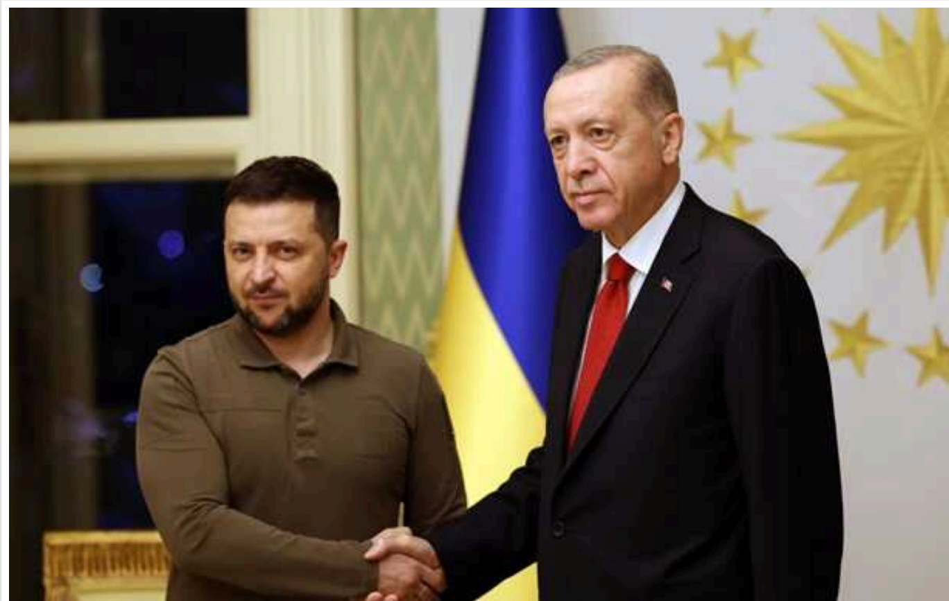
В Офісі президента розкрили деталі візиту Зеленського до Туреччини

Президент України Володимир Зеленський сьогодні, 8 березня, відвідає Туреччину. Він проведе зустріч з турецьким президентом Реджепом Тайпом Ердоганом.