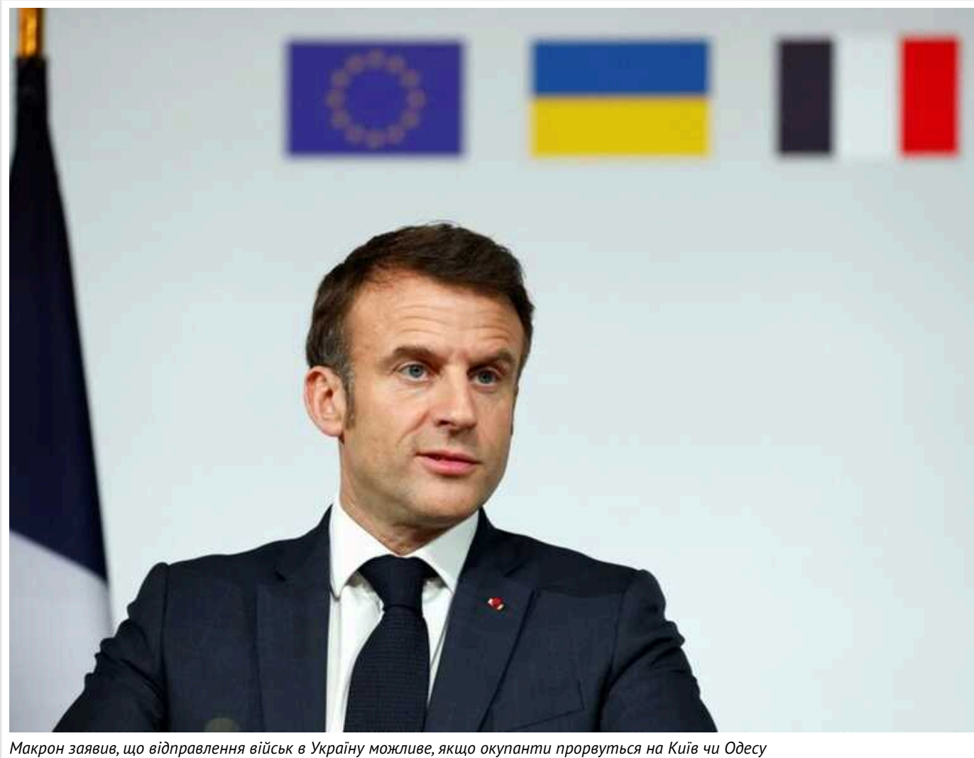
Макрон заявив, що відправлення військ в Україну можливе, якщо окупанти прорвуться на Київ чи Одесу

Президент Франції Емманюель Макрон на зустрічі з парламентськими партіями заявив, що відправлення військ в Україну можливе, якщо російські окупанти прорвуться на Київ чи Одесу.