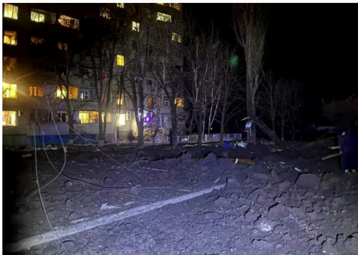
Кількість постраждалих через удар окупантів по Чугуєву зросла

Кількість поранених через обстріл Чугуєва на Харківщині 8 березня зросла до семи осіб. Серед них – 3-річна дитина.