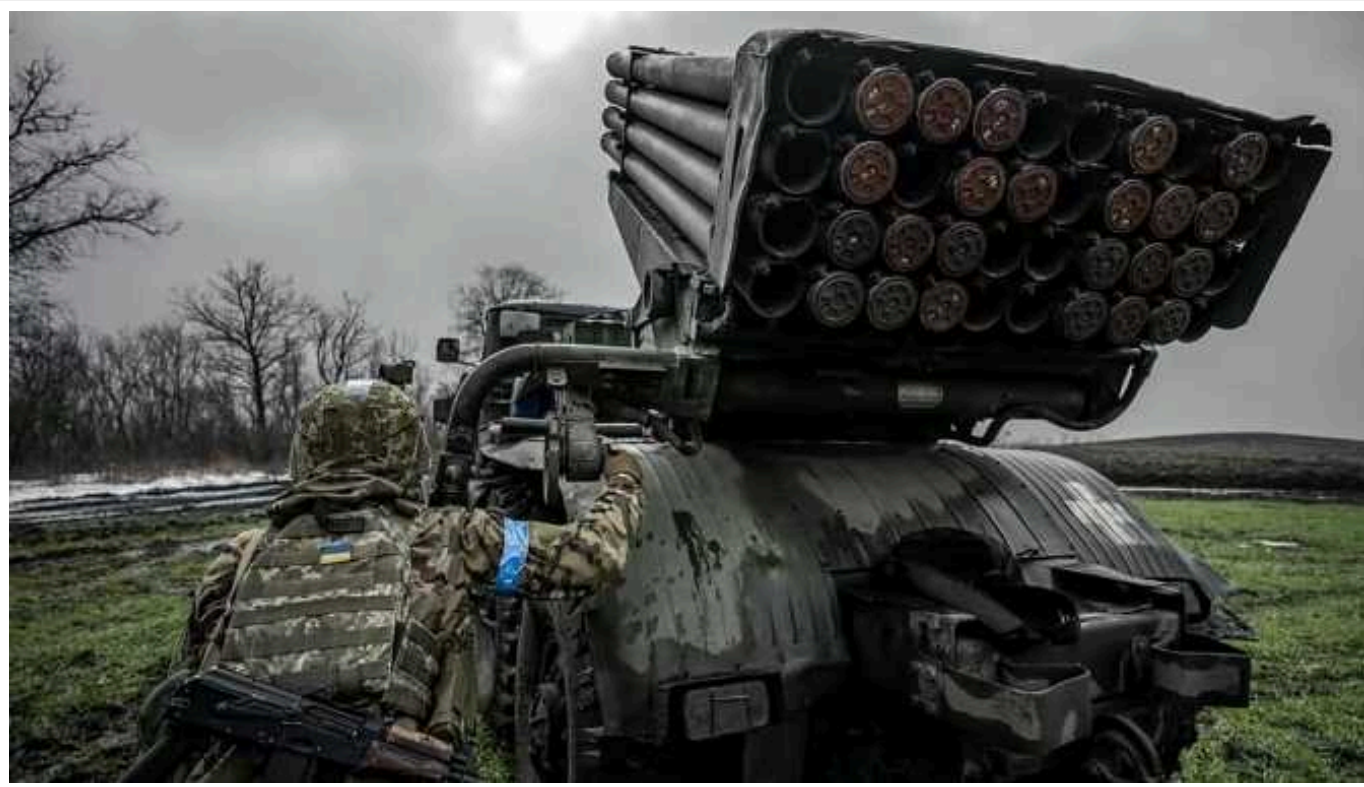
Ситуація на фронті: На Авдіївському та Новопавлівському напрямках відбулося 50 боєзіткнень

Російські загарбники атакували на 7 напрямках, загалом за минулу добу на фронті відбулося 86 бойових зіткнень, окупанти завдали 4 ракетних та 74 авіаційних удари, 101 раз обстріляли позиції українських військ та населені пункти з реактивних систем залпового вогню.