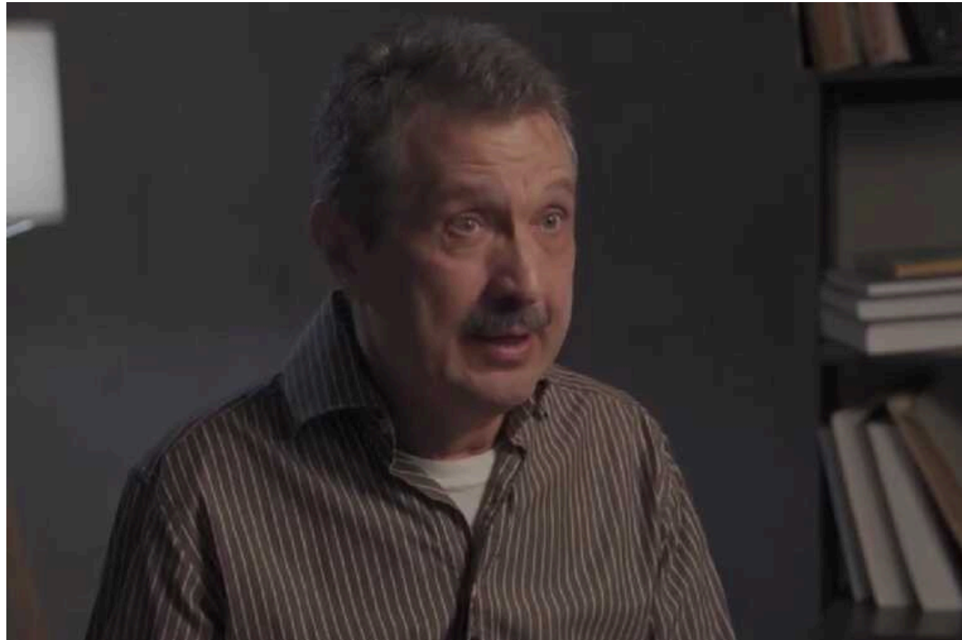
РФ накопичує в тилу «найбільші резерви», щоб провести наступ і розгромити українські війська за рік-півтора

Про це, із посиланням на свої джерела, заявив військовий експерт російської опозиційної "Нової газети" Валерій Ширяєв в інтерв'ю журналісту Олексію Пивоварову.