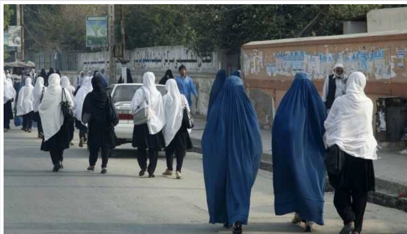
В Афганістані таліби заарештовують жінок, які порушують ісламський дрес-код

Таліби почали заарештовувати жінок в Афганістані за недотримання указу про носіння хіджабу.