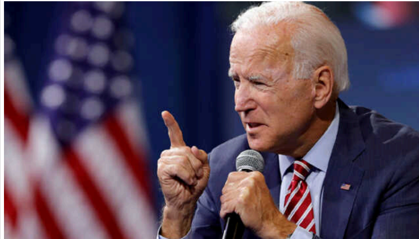
Президент Байден звинуватив Трампа у блокуванні закону про заходи боротьби з мігрантами

Президент США Джо Байден виступив з критикою експрезидента Дональда Трампа, який, за його словами, завадив ухваленню Конгресом заходів посилення боротьби з мігрантами на американсько-мексиканському кордоні.