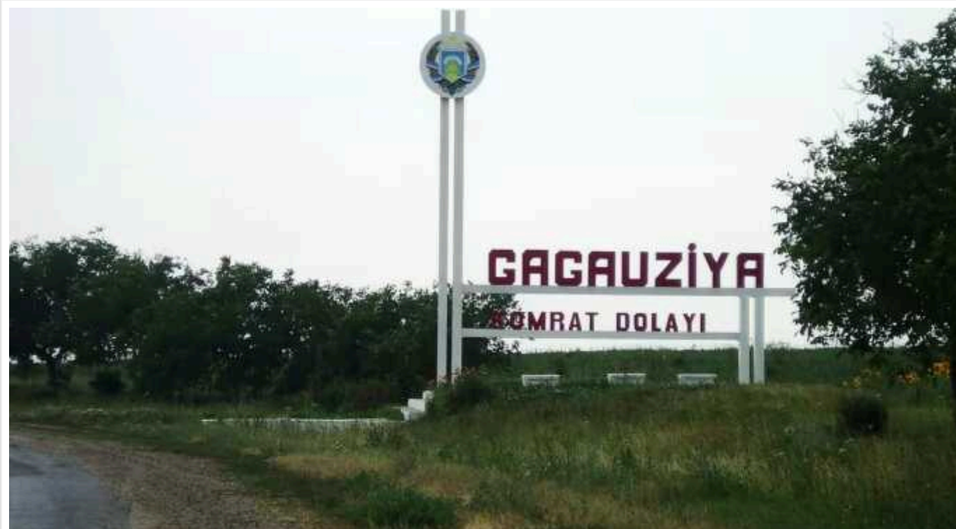
Кремль хоче використати Гагаузію і Придністров'я, щоб дестабілізувати ситуацію в Молдові, – ISW

Кремль сподівається використати Придністров'я і Гагаузію, щоб проводити гібридні операції для дестабілізації ситуації в Молдові напередодні переговорів про вступ до ЄС і президентських виборів.