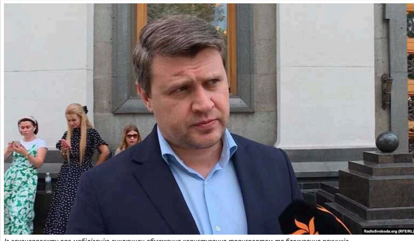
Із законопроекту про мобілізацію виключили обмеження користування транспортом та блокування рахунків

Про це повідомив член комітету з питань нацбезпеки Вадим Івченко.