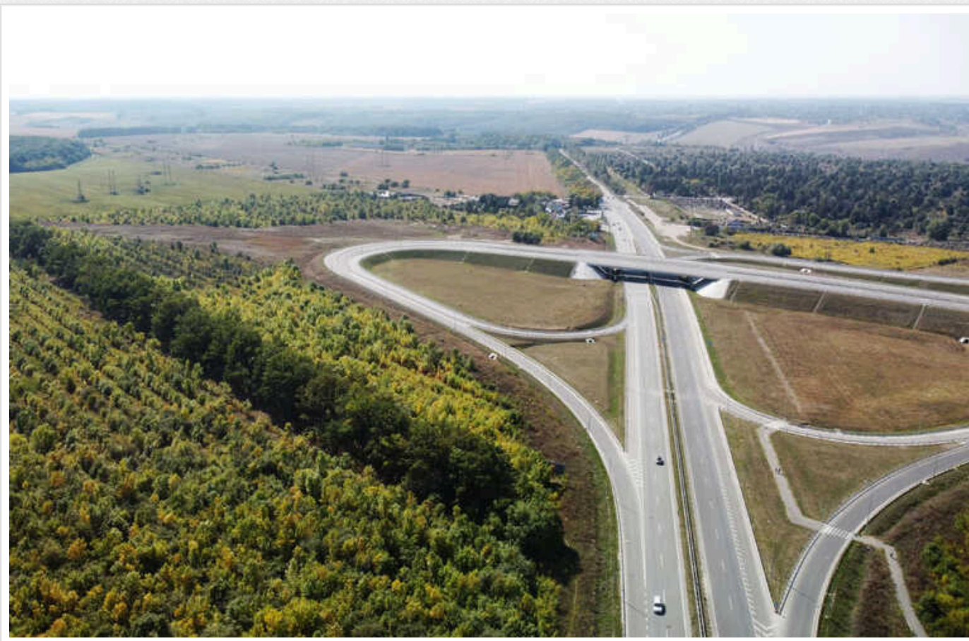
У прифронтовій Миколаївській області збудують розв'язку за 2 мільярди гривень

Її довжина становитиме 8 кілометрів, в очікуваний термін завершення будівництва – 30 квітня 2025 року.