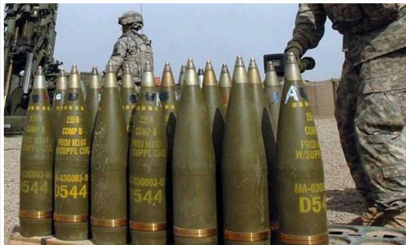
Чехія збрала кошти на закупівлю 800 тисяч снарядів для України

На цьому наголосив президент Чехії Петр Павел, повідомляє інформгентство СТК.