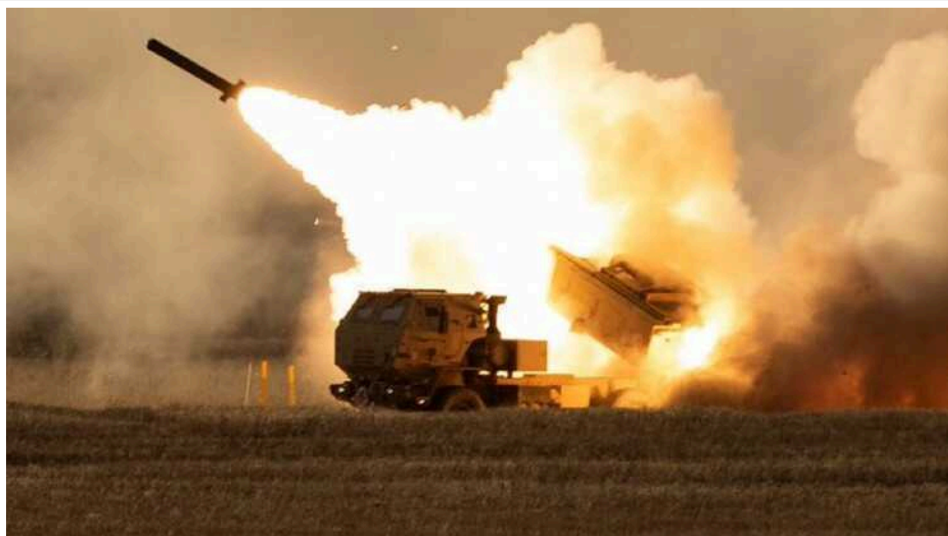
Знищений окупантами HIMARS: які висновки має зробити Україна