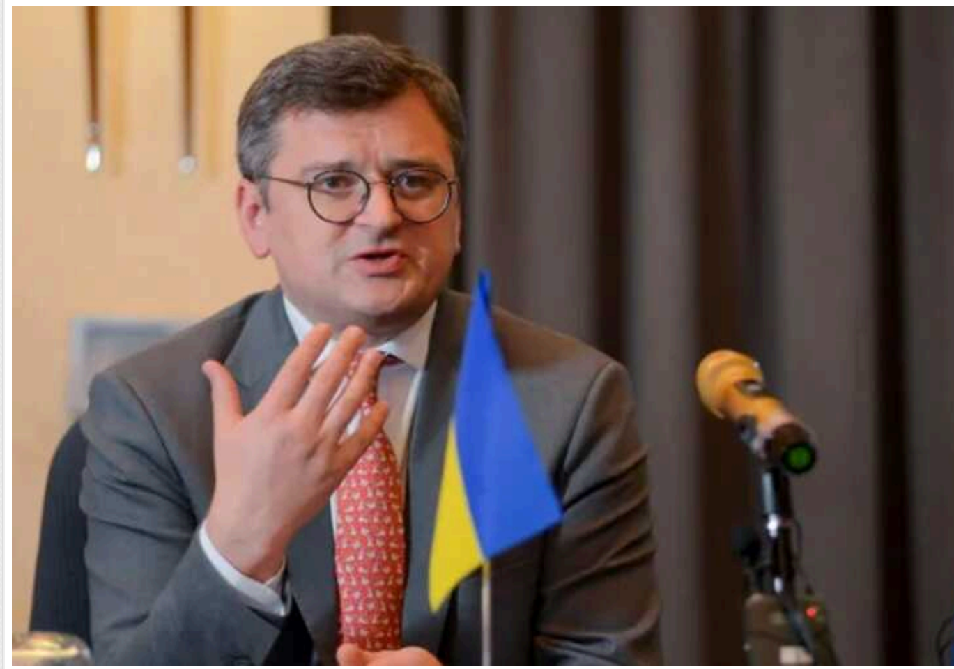
Кулеба: Союзникам потрібно прискоритись, якщо вони хочуть відновлення миру в Європі

Міністр закордонних справ України Дмитро Кулеба закликає партнерів прискорити виробництво озброєнь і заборонити експорт артилерійських боєприпасів на інші континенти. Він наголосив на важливості не шукати причини чому щось неможливе, а робити неможливе можливим та ухвалювати рішення.