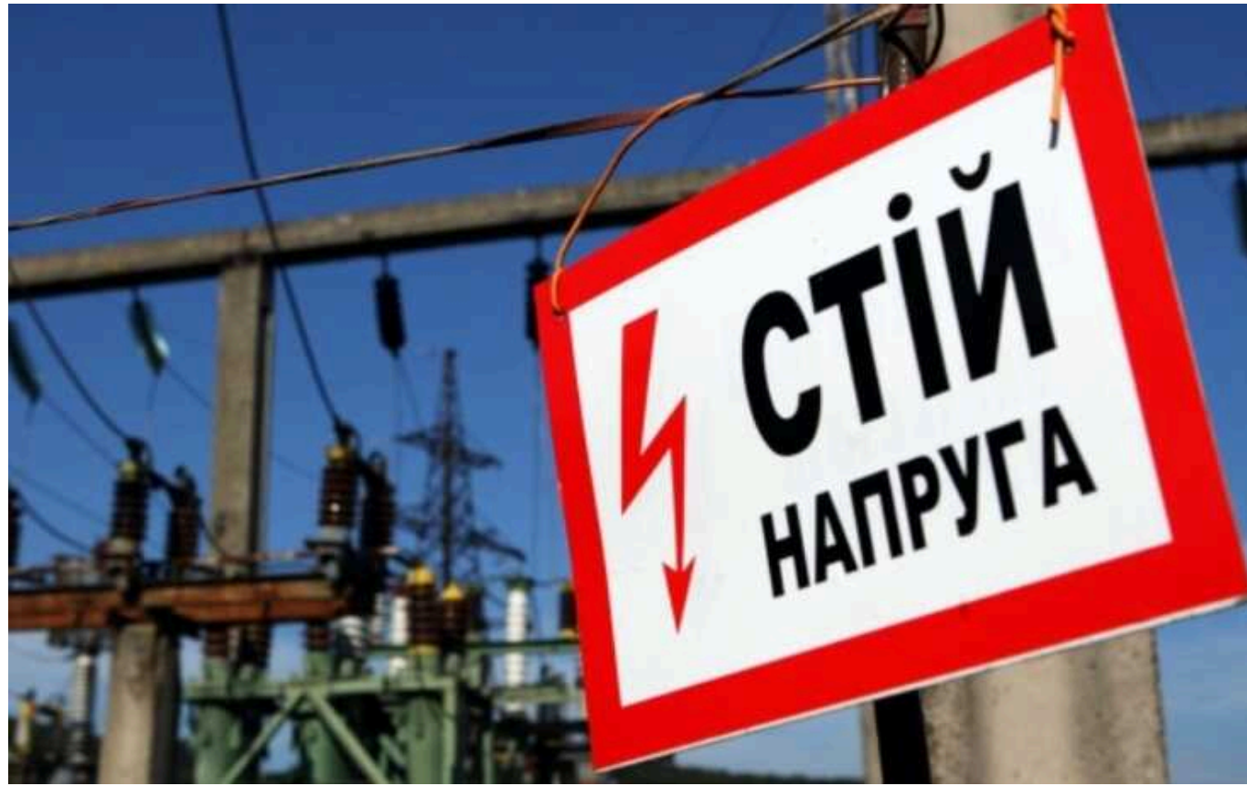
Голова НКРЕКП і завищені тарифи. Чи є тут корупційна складова?

Чи можуть українцям не підвищувати тарифи на електроенергію під час війни? Як держава недоотримує мільярди у бюджет та хто стоїть за цими аферами з тарифами? Яке відношення до цих схем має новий голова НКРЕКП Валерій Тарасюк?