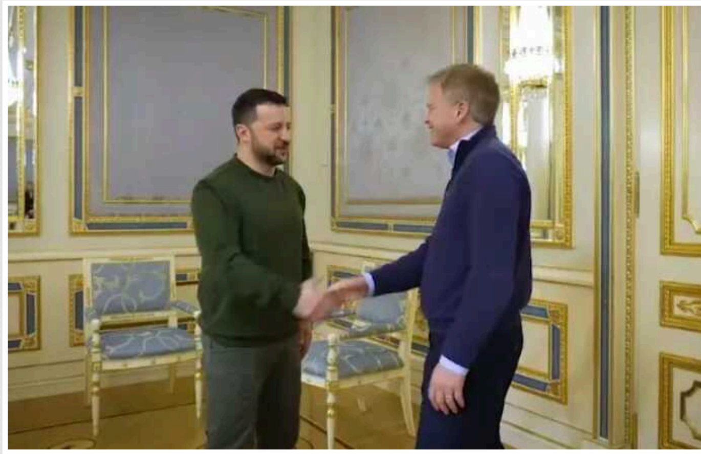
Зеленський зустрівся з міністром оборони Великої Британії

У четвер, 7 березня, президент України Володимир Зеленський зустрівся з державним секретарем Сполученого Королівства Великої Британії і Північної Ірландії з питань оборони Грантом Шепсом. Політики обговорили продовження оборонної співпраці між двома країнами.