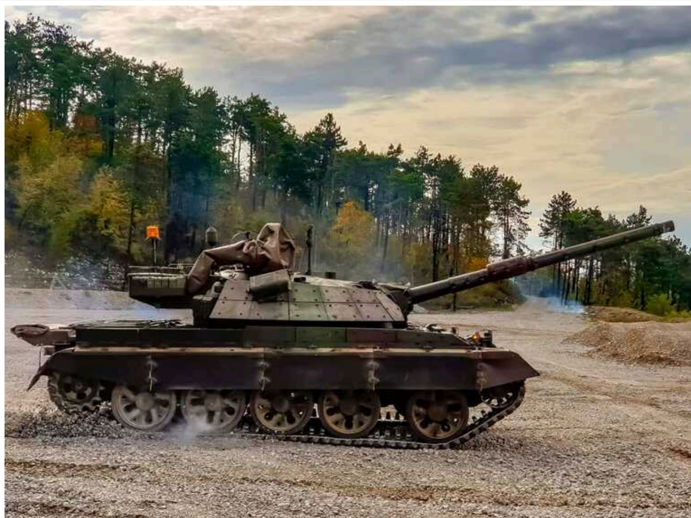
Збройні сили показали обслуговування рідкісного М-55S зі Словенії

За даними бійців 5 ОТБ, кожен словенський танк перебуває у бойовій готовності до оборони України.