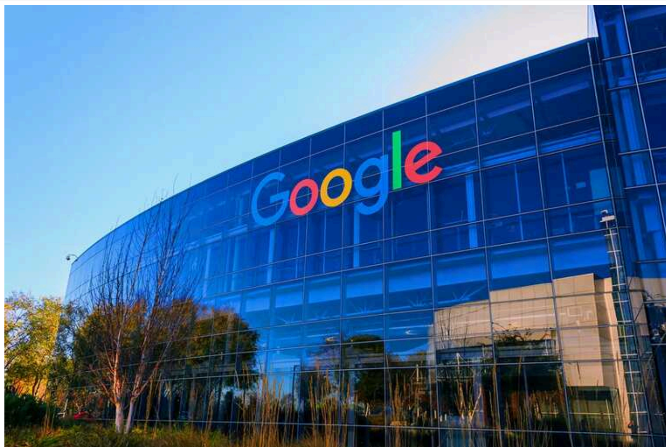
Корпорація Google оголосила про радикальні зміни в роботі пошукової системи

Google готує значні зміни у роботі своєї пошукової системи.