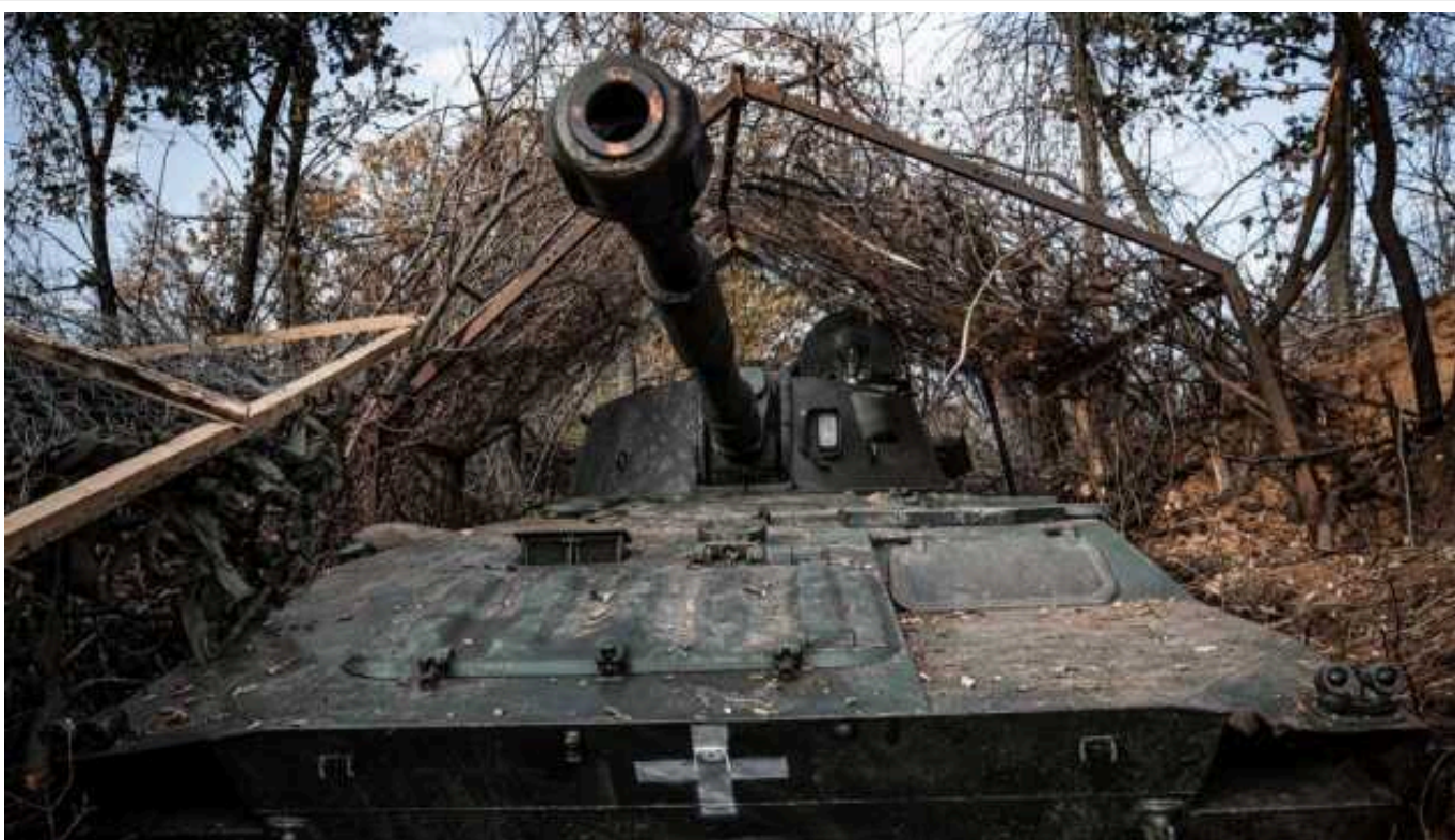
Ситуація на фронті: на Авдіївському й Новопавлівському напрямках відбито 39 атак

Сили оборони України протягом доби відбили 51 атаку російських військ на чотирьох напрямках та один штурм на лівому березі Дніпра у Херсонській області.