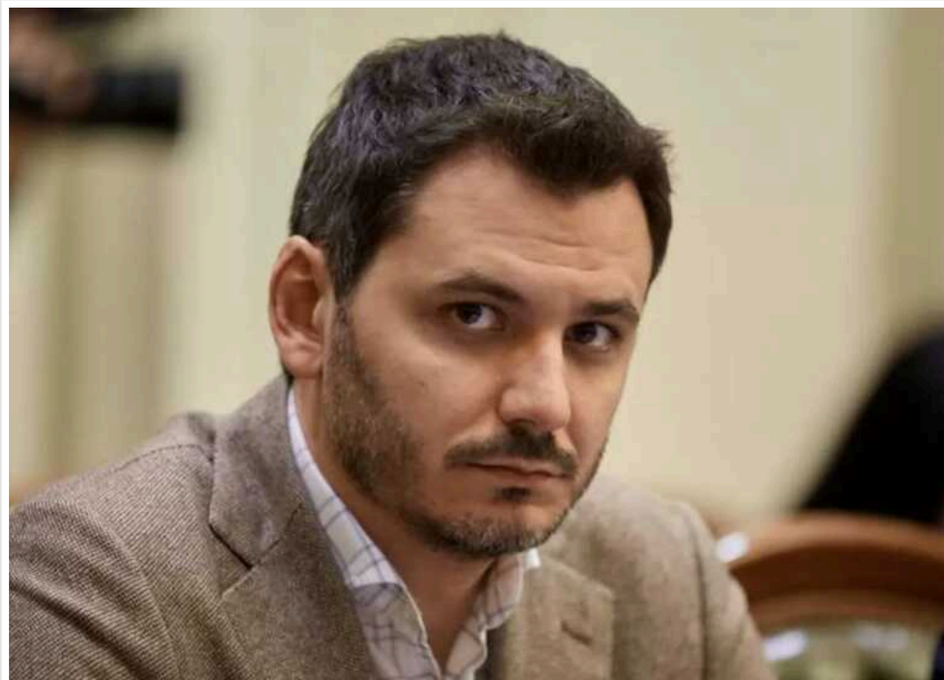
Нардеп Чернев пропонує мобілізувати ув'язнених, але за власним бажанням

Депутат Верховної Ради від фракції "Слуга народу", заступник голови парламентського комітету з питань національної безпеки, оборони та розвідки Єгор Чернев пропонує мобілізувати за власним бажанням тих, хто зараз відбуває покарання за неважкі злочини.