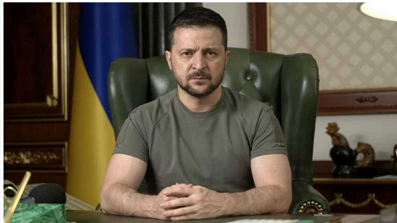
"Працювати на дипломатичному фронті було бажанням Залужного", – Зеленський