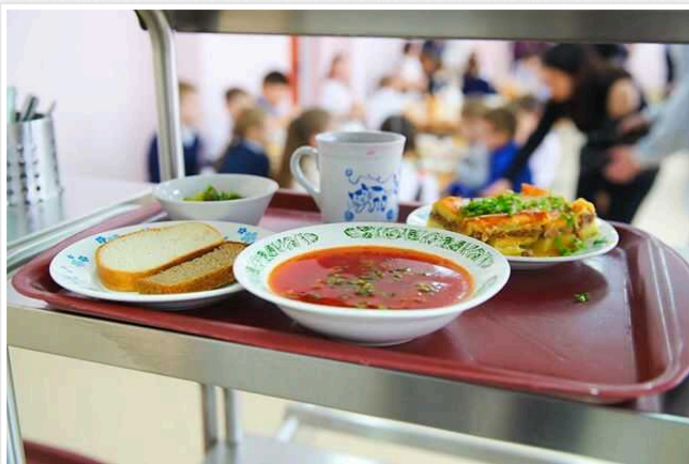
У дитячих садках Бучі продовжується фестиваль найвищих цін на їжу: тепер куряче філе дорожче ринку

Відділ освіти Бучанської міської ради Київської області 29 лютого за результатами тендеру замовив КП громадського харчування «Продсервіс» Бучанської міської ради постачання м'яса у дитячі садки району на 1,83 млн грн.