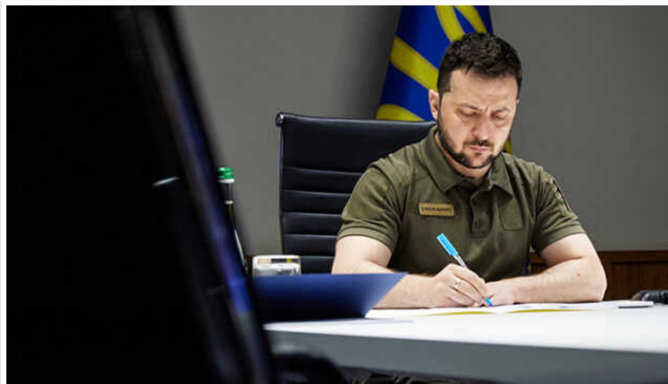
Президент Зеленський підписав указ про демобілізацію строковиків

Президент Володимир Зеленський підписав указ про звільнення в запас строковиків, в яких завершився термін військової служби під час воєнного стану.