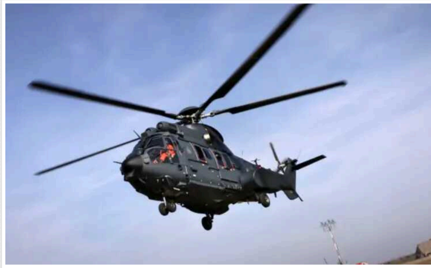
Угорщина нарощує військовий потенціал за рахунок розширення парку гелікоптерів H225M

Вертоліт є справжнім багатопільовим засобом, що довів свою надійність у зонах бойових дій. H-225M замінять вертольоти Mi-8 і Mi-17, що перебувають на озброєнні Угорщини.