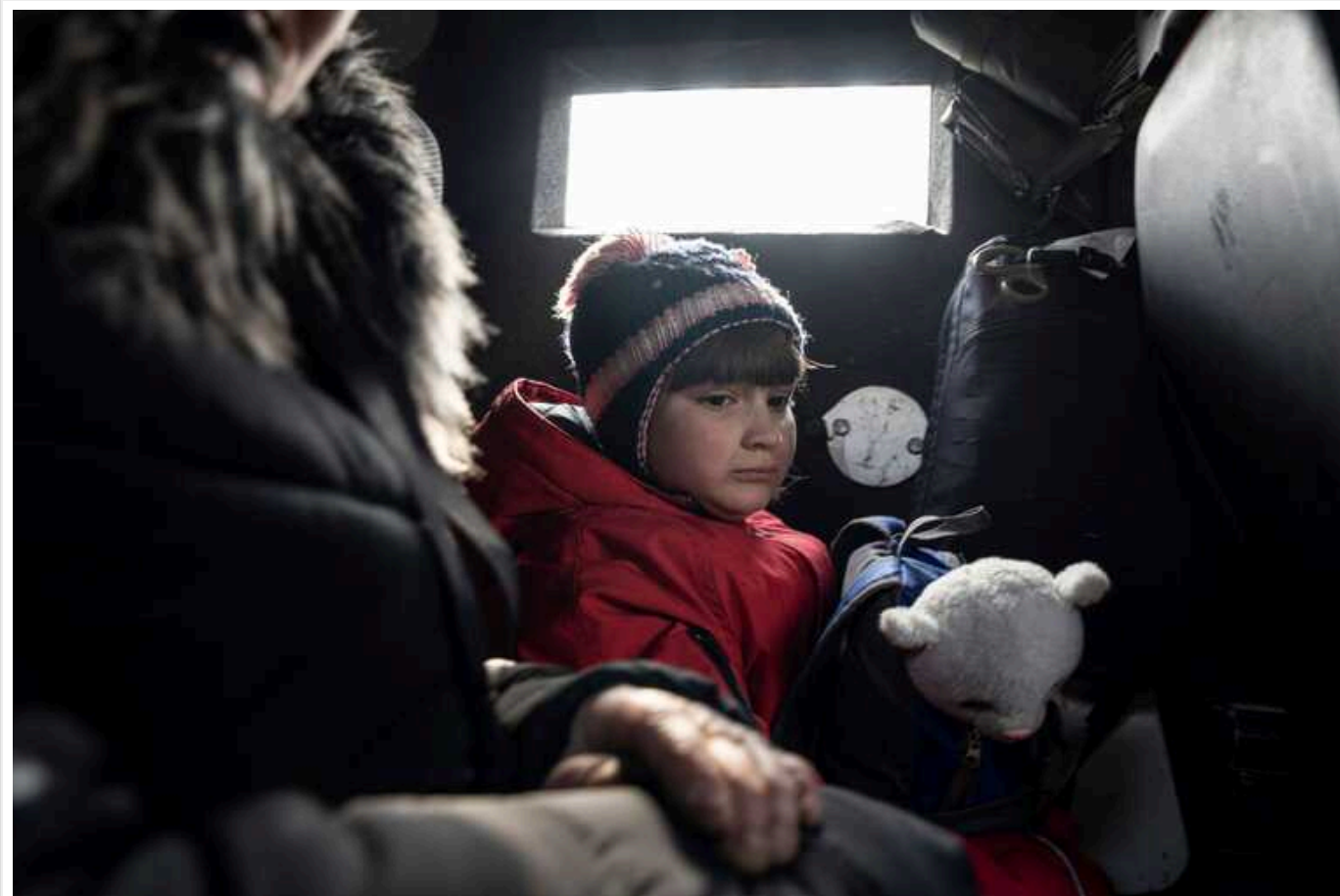
На Харківщині оголосили примусову та обов'язкову евакуацію з низки населених пунктів на Куп'янському напрямку