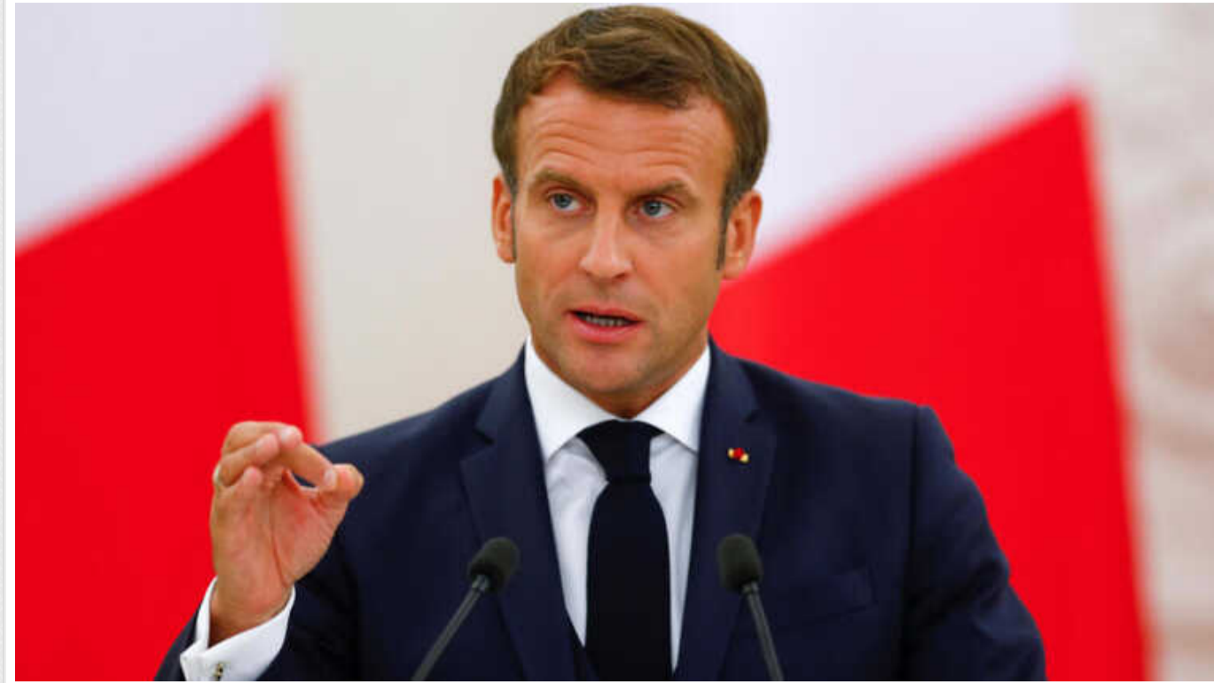
Президент Франції заявив про відсутність обмежень у підтримці України - ЗМІ

Президент Франції Еммануель Макрон на зустрічі з лідерами партій заявив, що не існує жодних обмежень і червоних ліній у підтримці Францією України.