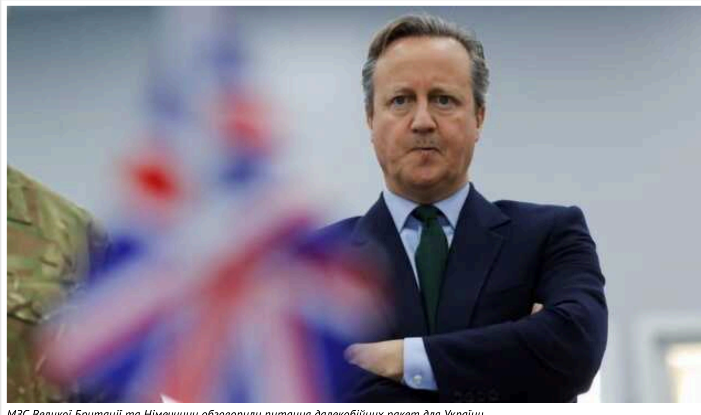
МЗС Великої Британії та Німеччини обговорили питання далекобійних ракет для України

Міністри закордонних справ Великої Британії й Німеччини під час других стратегічних консультацій обговорили питання постачання Україні далекобійних ракет.