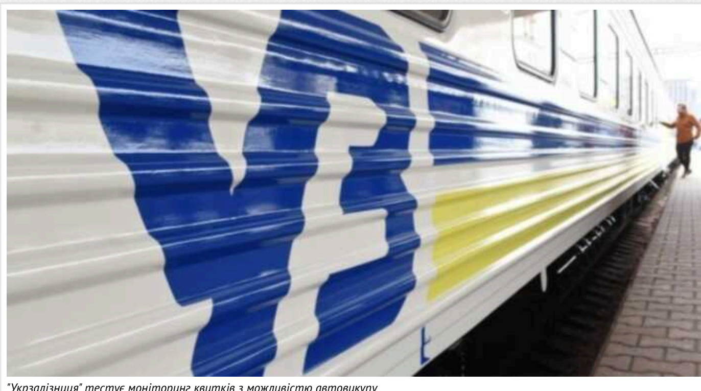
"Укрзалізниця" тестує моніторинг квитків з можливістю автовикупу

"Укрзалізниця" запускає бета-тестування моніторингу квитків з можливістю автовикупу на поїзди внутрішнього сполучення.