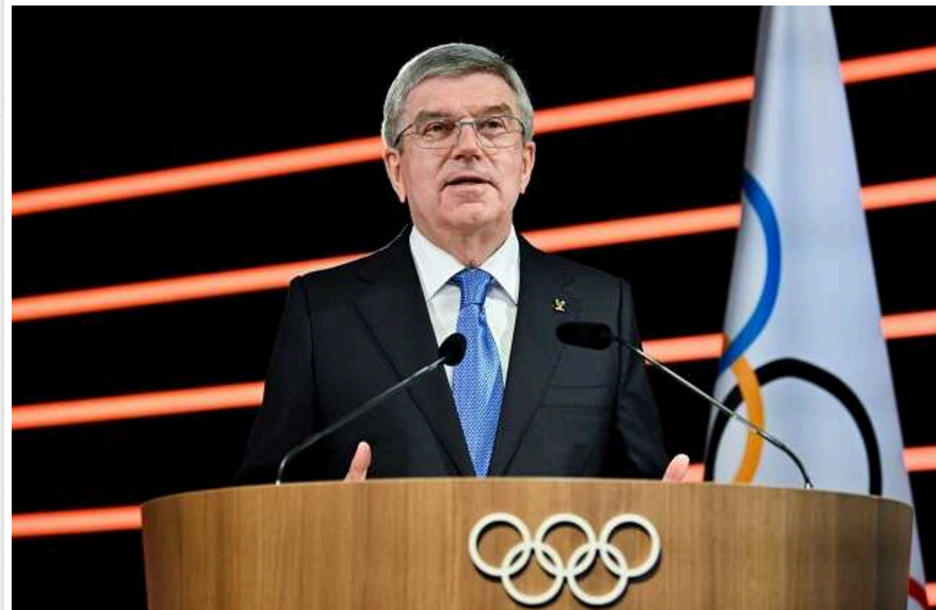
МОК красиво поставив на місце Лаврова після ниття про "зраду": "Це вони вторглися в Україну"

Президент Міжнародного олімпійського комітету (МОК) Томас Бах категорично відповів міністру закордонних справ РФ Сергію Лаврову, який звинуватив функціонера у зраді спорту. Поплічник режиму Володимира Путіна називав політично вмотивованим усунення атлетів із Росії від змагань, на що глава МОК нагадав йому про війну в Україні та ганебну ОІ-2014 у Сочі.