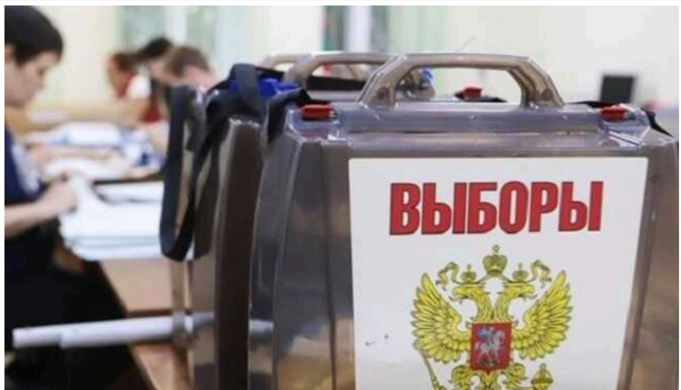
Ліцеїстам з Луганська охорону дільниць на "виборах" Путіна зарахують як практику

У тимчасово окупованому Луганську до охорони порядку на дільницях під час російських псевдовиборів залучатимуть учнів місцевого ліцею.