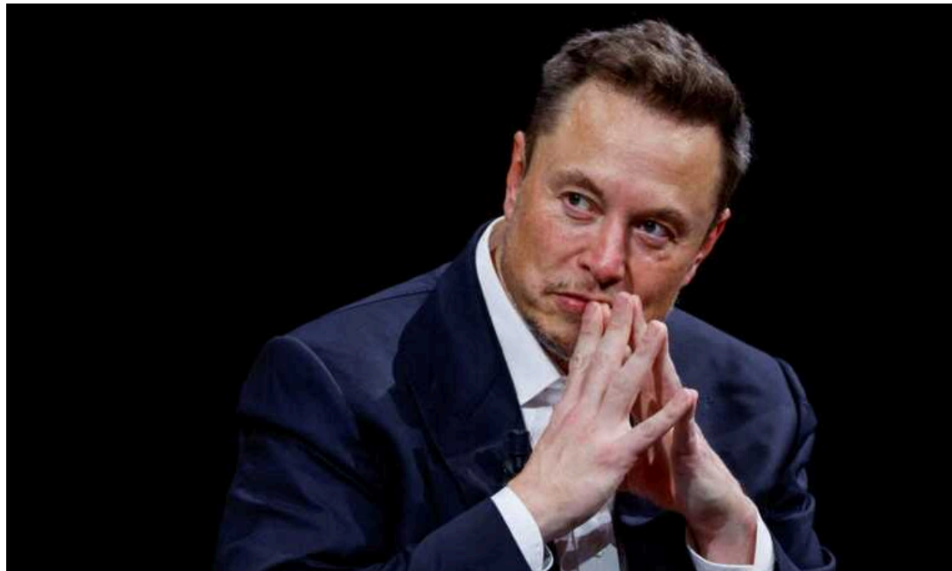
Twitter може перестати показувати кількість лайків та репостів

Соціальна мережа X, колишній Twitter, може перестати показувати кількість лайків і репостів, які отримують люди.