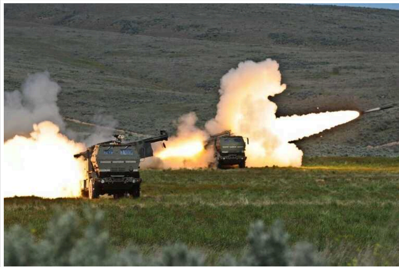
HIMARS «завітав» до окупантів на Сватівщині: горів склад боєприпасів

На окупованій частині Луганської області загорівся склад боєприпасів російських загарбників.