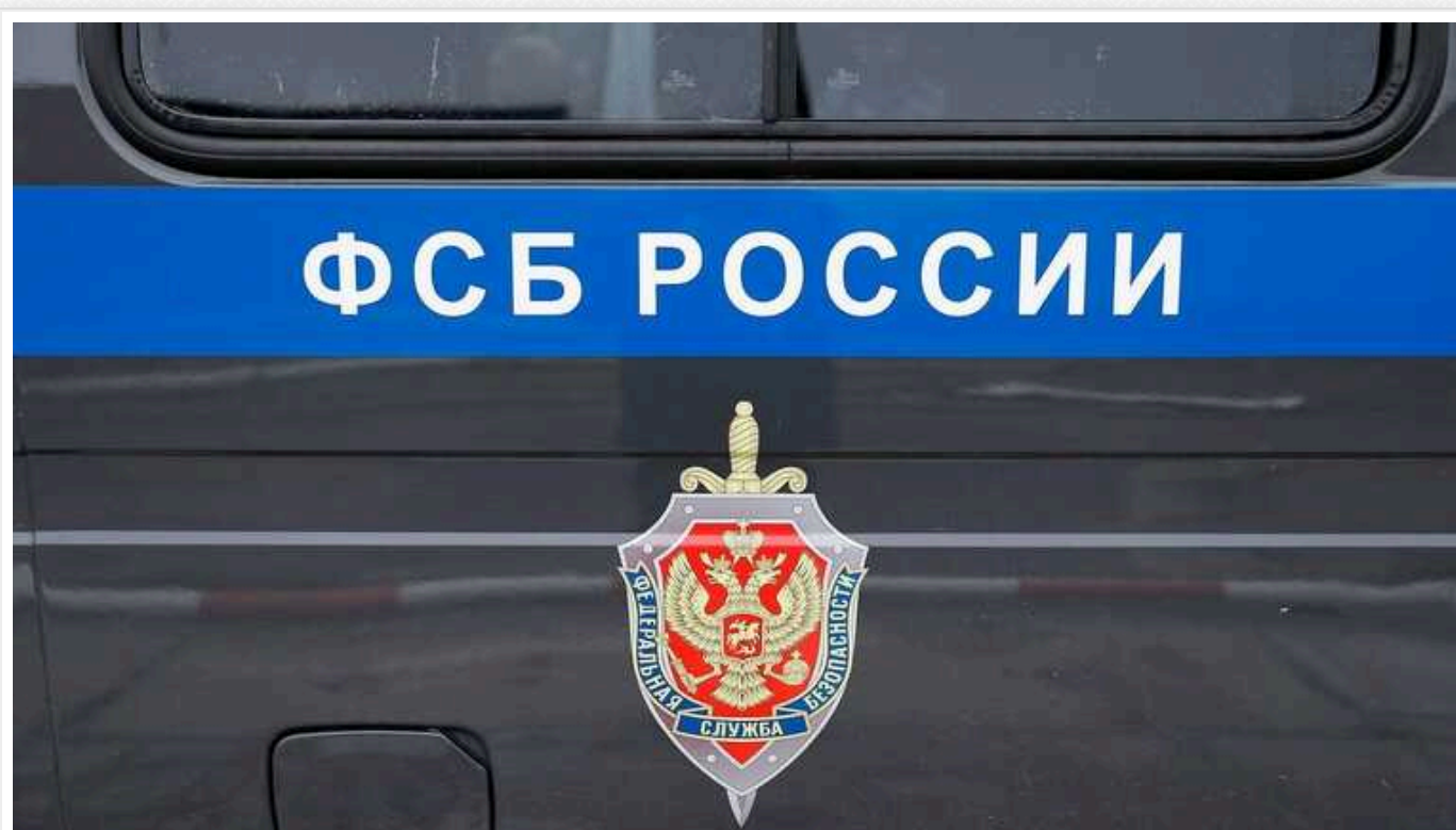
ФСБ зганьбилась у пошуках терористів на окупованих територіях України

Співробітники російської Федеральної служби безпеки, які щосили оруднують на тимчасово окупованих територіях України, пробіли нове дно. Затримання українців, які фактично виявилися заручниками, ідуть повним ходом – причому приводи стали особливо збоченими.