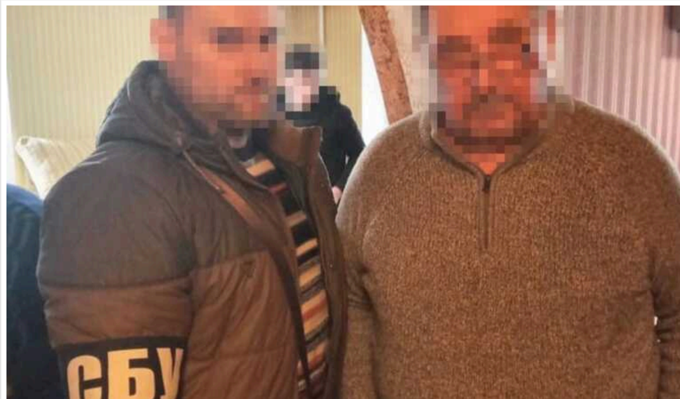
СБУ викрила ексчиновників «Харківгазу»: передавали ворогу карти газових мереж для завдання ракетних ударів

Служба безпеки України викрила двох ексчиновників, які співпрацювали з ворогом у період боїв за Харків та передали карти газових мереж для завдання ракетних ударів.