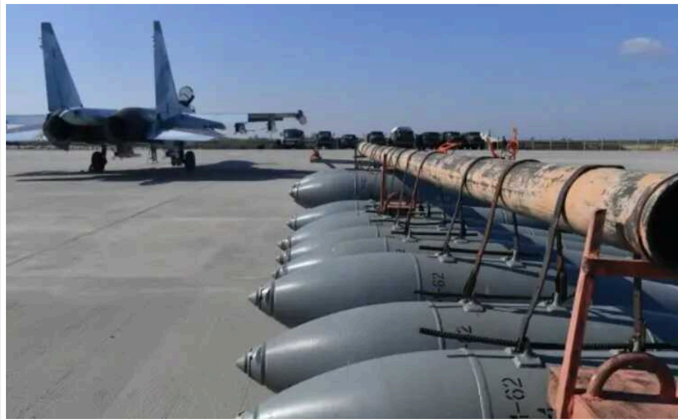
NYT: Армія РФ застосовує КАБи для швидкого захоплення територій

За словами полковника української армії у відставці, авіабомби є дорогим, але, водночас, ефективним інструментом для противника. Удари по позиціях ЗСУ розчищають шлях для піхоти окупантів.