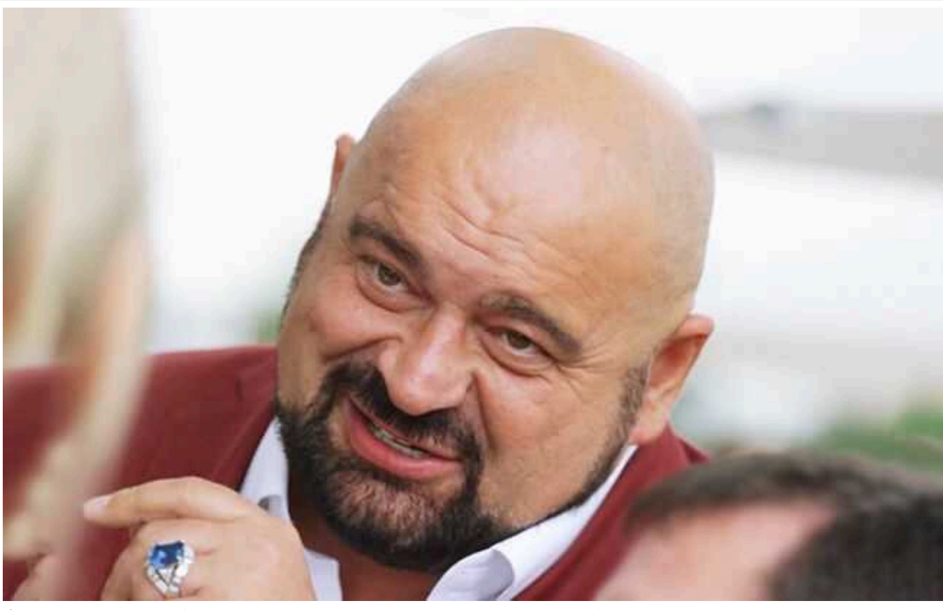
Фірма газового олігарха Злочевського зникла зі справи про ухилення від сплати податків

ТОВ «Енерго-Сервісна компанія «Еско-Північ», котра входить до Burisma Group газового олігарха Миколи Злочевського, зникла зі справи про ухилення від сплати податків.