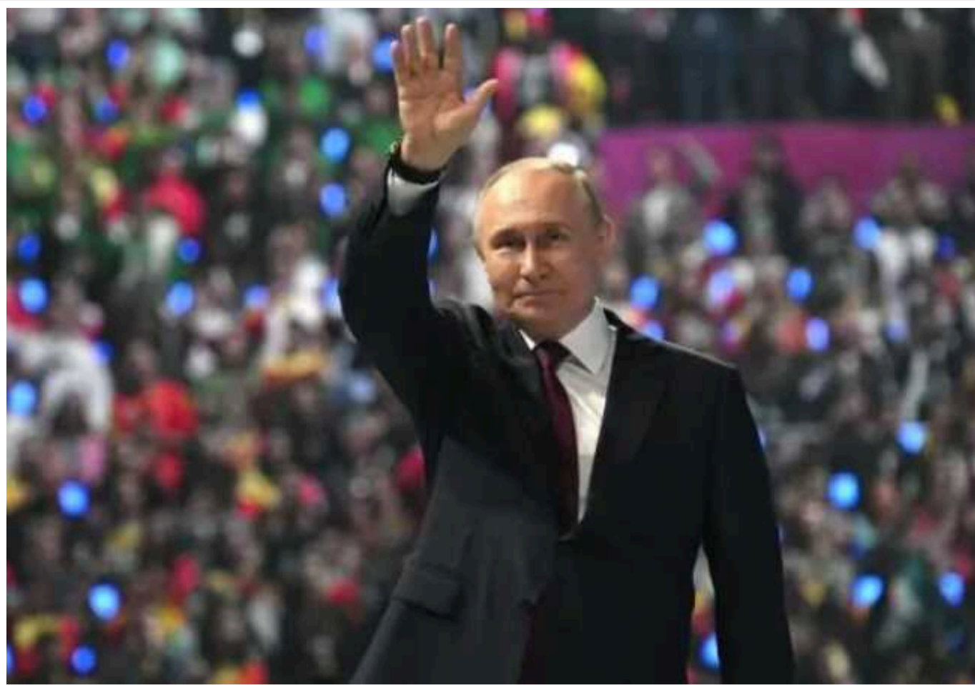
У РФ послання Путіна провалилося на ростБ

Двогодинне звернення президента Росії не викликало ажіотажу. За рік кількість глядачів, які були зацікавлені заявами голови Кремля, скоротилася практично вдвічі.