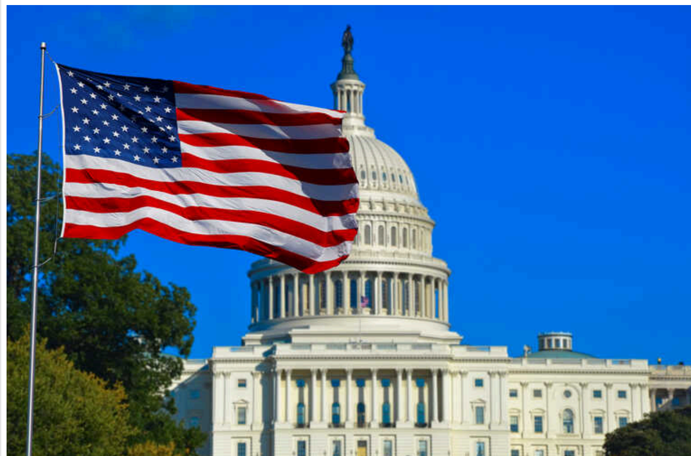
У Білому домі підтвердили, що Зеленська та Навальна відмовилися бути присутніми на зверненні президента до Конгресу

“Ми, звичайно, поважаємо їхнє рішення відмовитися від участі... Безумовно, це була можливість визнати відданість Америки Україні та боротьби, мужності та стійкості українського народу”, – заявив представник Ради нацбезпеки Білого дому Джон Кірбі.