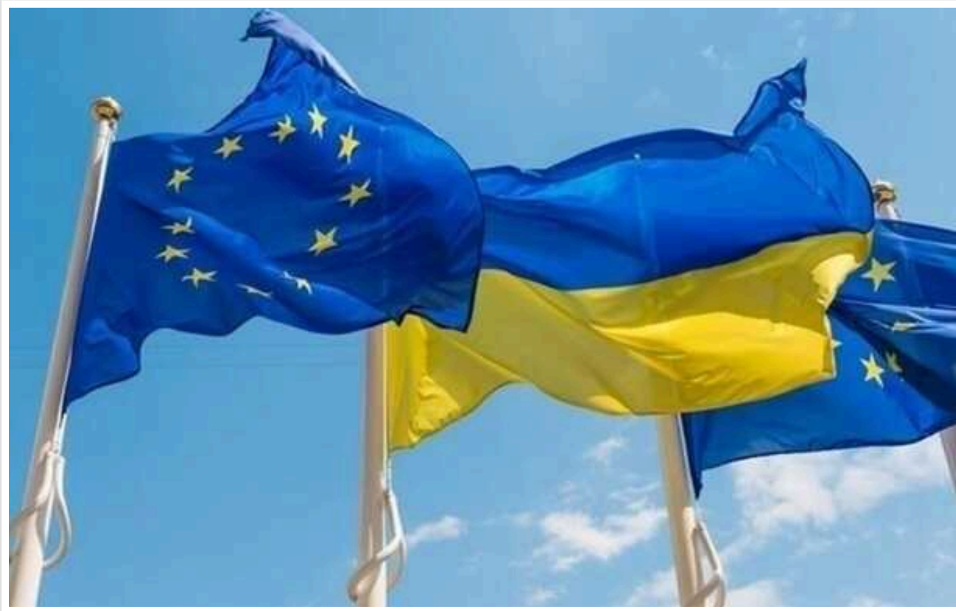
Євросоюз зможе скасовувати потік грошей із програми на 50 мільярдів євро, якщо Україна не буде продовжувати реформи

Програма реформ від EC Ukraine Facility міститиме близько 140 умов-індикаторів, кожна із яких матиме свою "ціну". За відсутності реформ гроші просто "згорять".