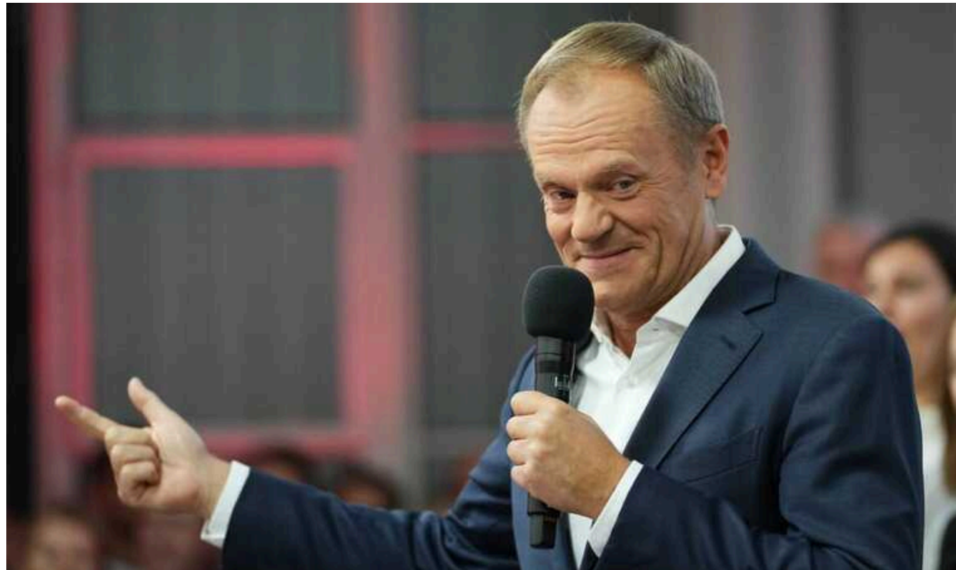
Польща пропонує ЄС скасувати всі торгові пільги, які Україна отримала після початку повномасштабної війни, – Туск

Прем'єр-міністр Польщі Дональд Туск запропонував Євросоюзу скасувати торгові преференції, які були надані Україні після початку вторгнення.