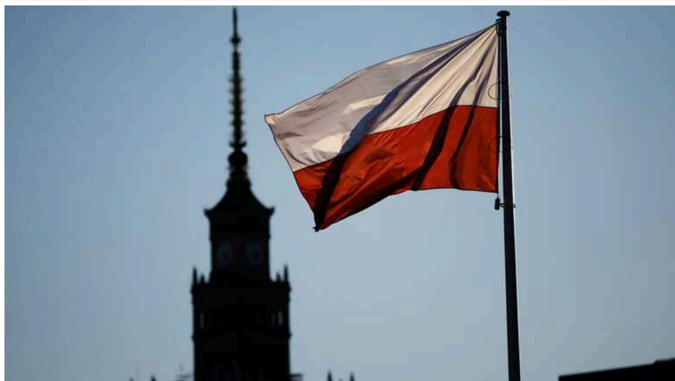
Заступник глави МЗС Польщі провів зустріч зі спецпредставником Китаю щодо України

Заступник міністра закордонних справ Польщі Владислав Теофіл Бартошевський зустрівся у Варшаві зі спеціальним представником уряду Китаю з питань Євразії Лі Хуеєм, де вони обговорили російську агресію проти України.