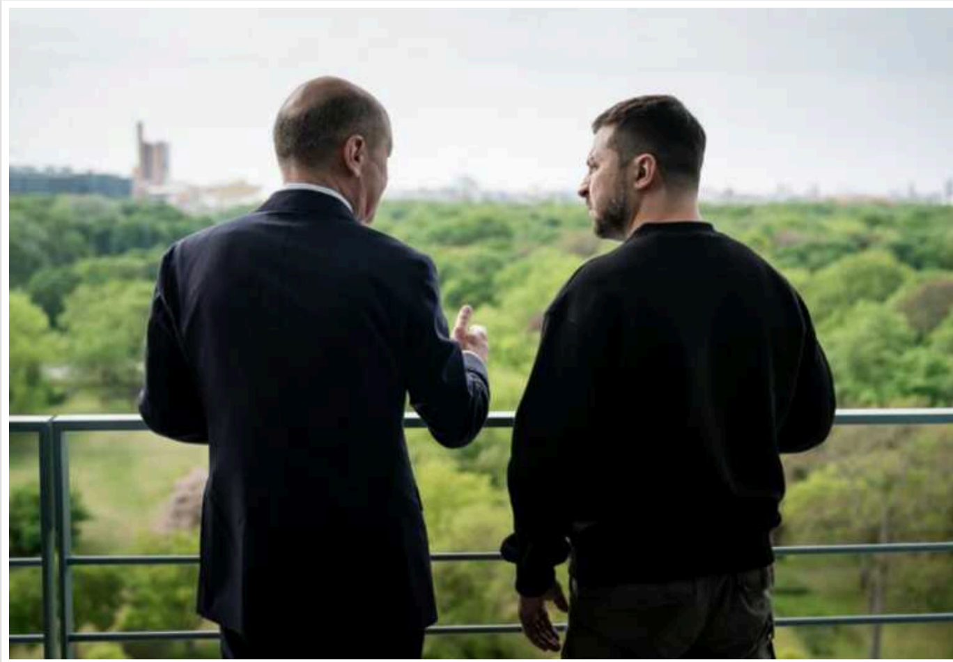
Шольц хоче, щоб Україна погодилася на мирні переговори

Кінцева мета канцлера Німеччини Шольца полягає в тому, щоб Україна погодилася на мирні переговори, причому "раніше, ніж пізніше".