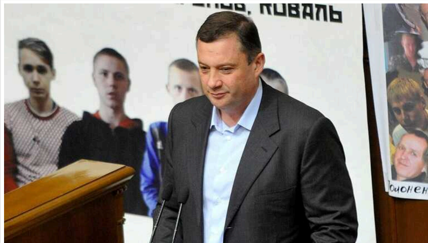
Вищий антикорупційний суд відмовився закрити справу нардепа Дубневича

ВАКС відмовився закрити справу за обвинуваченням народного депутата Ярослава Дубневича та ще восьми осіб у заволодінні понад 93 млн гривень коштів філії «Центр забезпечення виробництва» АТ «Укрзалізниця». Про це повідомляє САП.