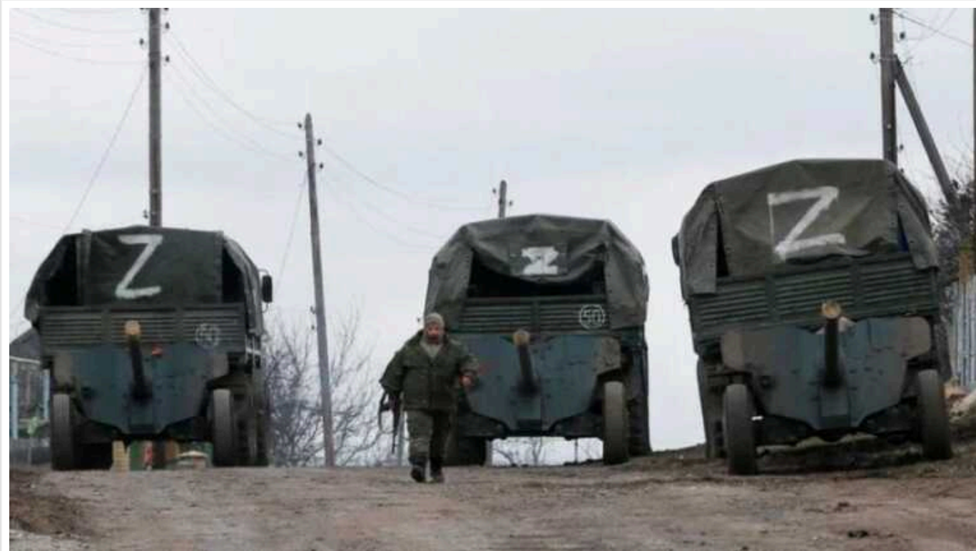
Окупанти вчинили ще один військовий злочин проти українських військових

Росіяни засудили двох українських військових до довічного позбавлення волі у колонії особливого режиму.