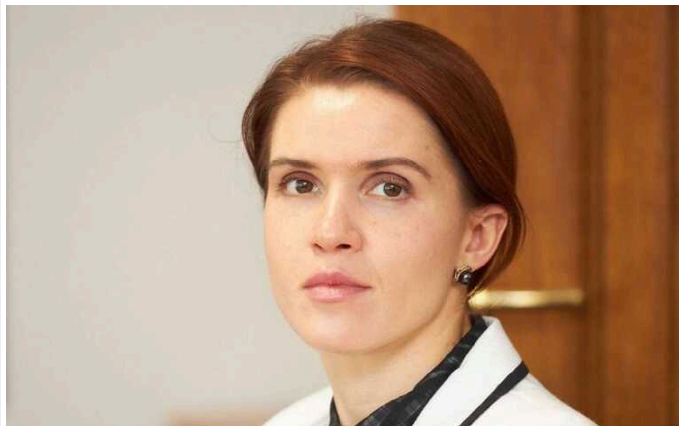
Безугла обурилась роботою над законопроектом про мобілізацію та знову залишила засідання комітету

Народна депутатка Мар'яна Безугла знову різко висловилася про роботу Комітету ВРУ з питань національної безпеки, оборони та розвідки та розгляд законопроекту про мобілізацію. До того ж вона залишила засідання, поки "не почнется конкретика".