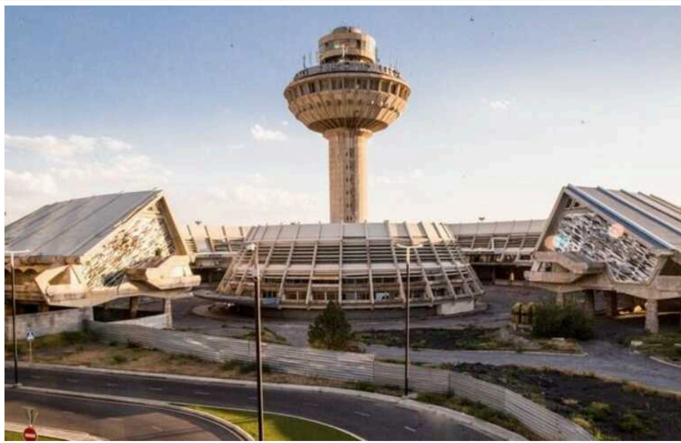
Вірменія офіційно захотіла вигнати з аеропорту "Звартноц" російських прикордонників

Прикордонні війська Вірменії мають нести службу на території аеропорту "Звартноц". Єреван сповістив про це Москву, чії солдати наразі розміщені на території летовища.