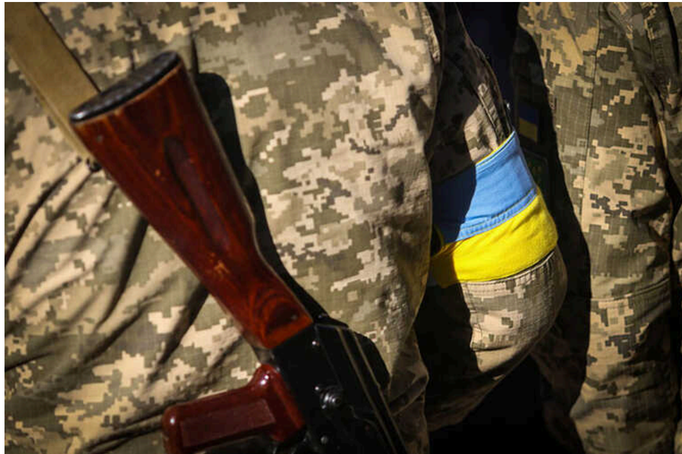
Суд виправдав військовозобов'язаного чоловіка, який побився з працівниками ТЦК, що прийшли вручити йому повістку

Все почалося з того, що ввечері чоловік вийшов надевір, а біля багатоповерхівки стояли представники ТЦК.