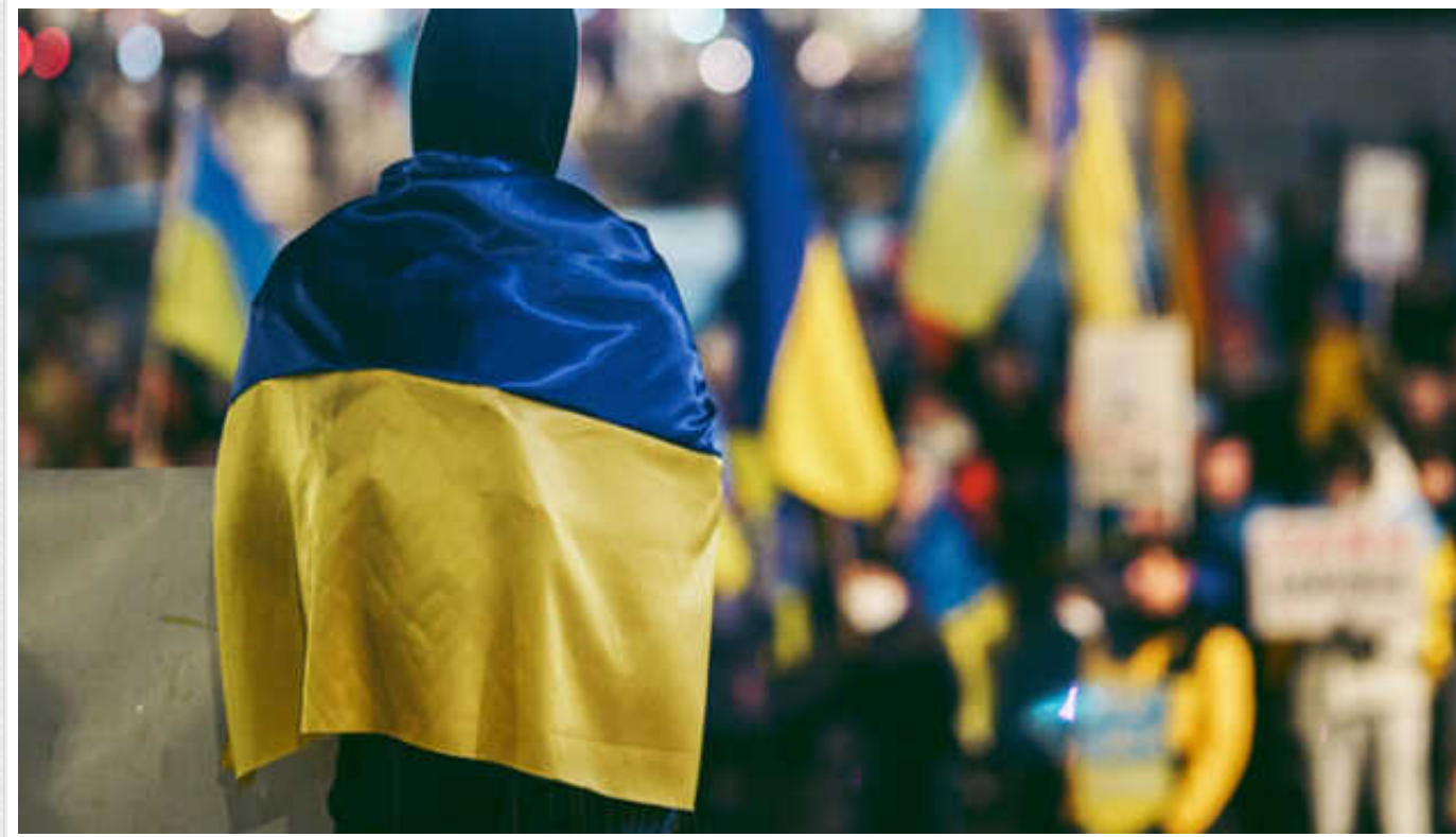
64,5% українців проти обмежень для ухиялнтів у законі про мобілізацію, – опитування