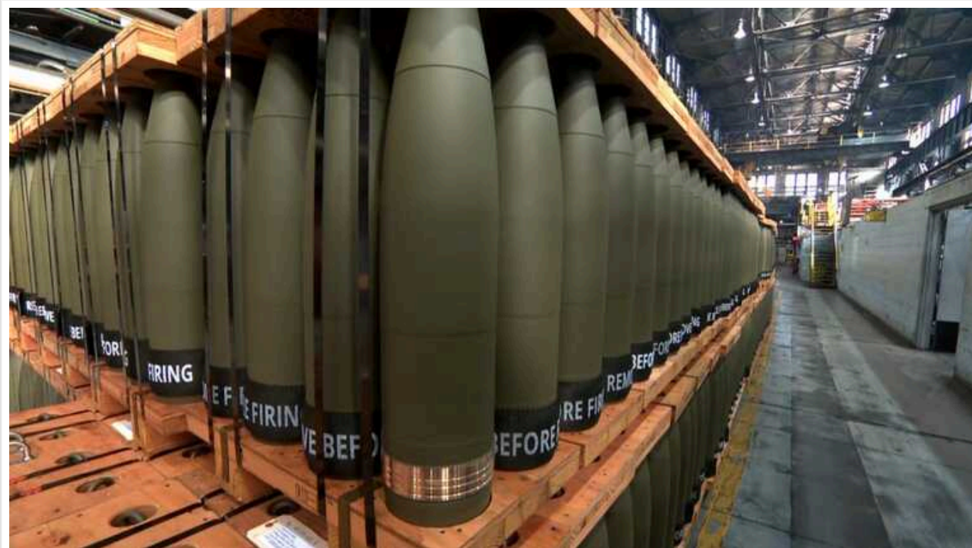
Українські союзники готові найближчими тижнями закупити для ЗСУ снаряди з ініціативи Чехії

Союзники України майже зібрали всю необхідну суму на закупівлю сотень тисяч снарядів для Києва з ініціативи Чехії, боеприпаси можуть бути доставлені протягом кількох тижнів.