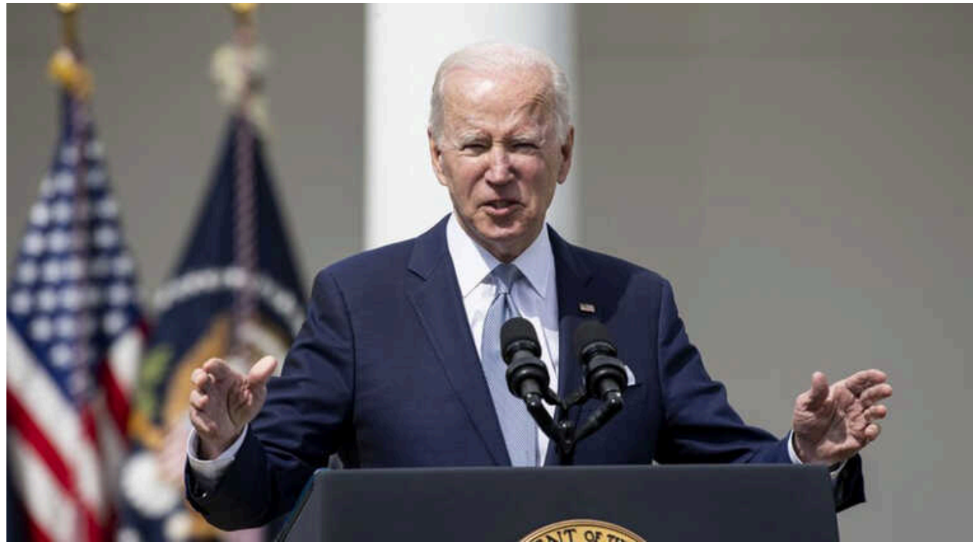
Адміністрація Байдена розчарована небажанням Європи конфіскувати російські активи через страхи, – ЗМІ

Рішучість Вашингтона, як йдеться у матеріалі Politico, викликала занепокоєння в європейських урядах, які побоюються, що такий крок налякає інвесторів у євро, а Москва може помститися, атакуючи європейські активи в Росії та розпочавши кібератаки проти західних країн.