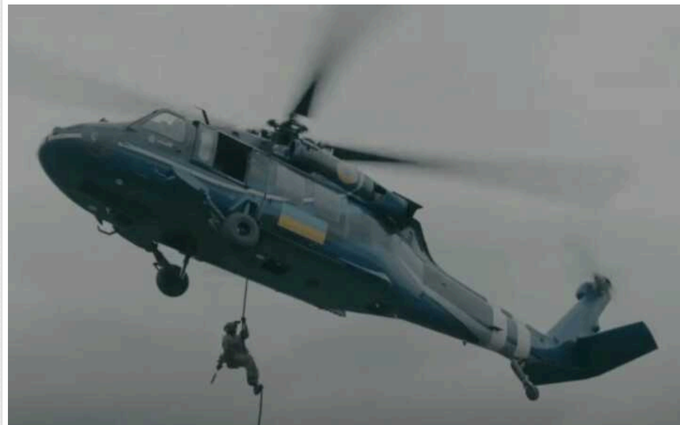
Що ГУР робить в Судані та якій стороні допомагає

Україна могла залучити спецпризначенців ГУР через взаємовідність таких дій. Судан непулічно постачав ЗСУ зброю, а Київ руйнував плани Москви й допомагає уряду боротись з повстанцями.